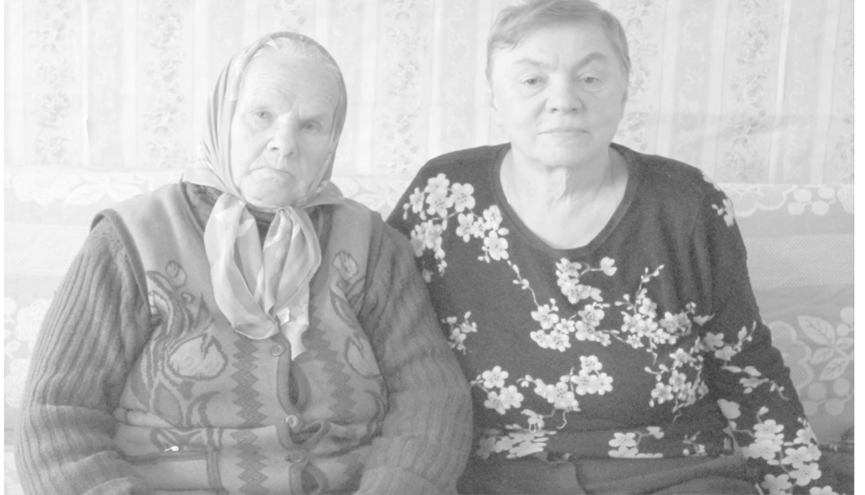
Мать и дочь, 2016 год